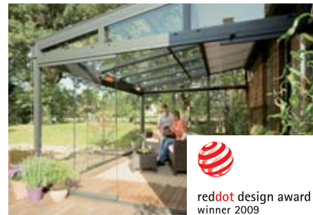
▼ Die Glasoase® aus den weinor Terrassenwelten