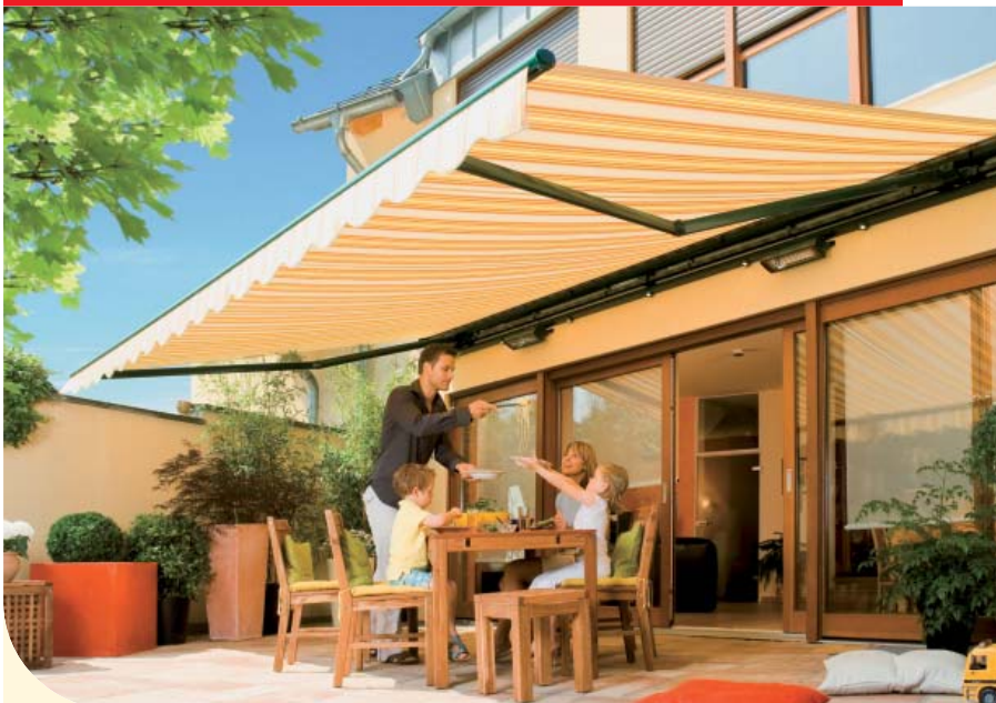
▲ weinor Markisen