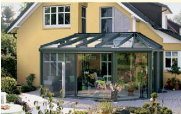
▲ weinor Wintergärten

Wie auch immer Sie Ihre Terrasse nutzen möchten, weinor hat das geeignete Produkt für Sie – Markise, Terrassendach, Glasoase® und Wintergarten